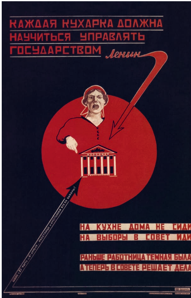
Плакат 1925 г. Авторы И.П. Макарычев (1901–1928), С.Б. Раев (1932–2001). Макарычев обучался в Строгановском училище и ВХУТЕМАСе. Умер в 27 лет, похоронен на Ваганьковском кладбище. Более подробных данных найти не удалось. Раев, член Союза художников СССР, советский политический портретист, медальер, лауреат бронзовых, серебряных и золотых медалей ВДНХ. Каким образом он сумел внести творческий вклад в создание плаката за семь лет до своего рождения — интересная тема для размышлений.