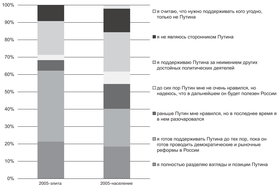
Рис. 2. С какой из предложенных оценок деятельности В. Путина на посту президента России вы бы скорее согласились?

тельность демонстрируют также законодатели, бизнесмены и руководители массмедиа. Потенциал открытого недовольства позицией президента, сравнимый или даже превышающий соответствующие показатели «простого народа», сконцентрирован в среде законодателей, журналистов и в бизнес-союзах.