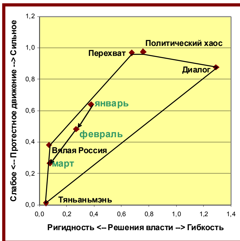
Рисунок 2. Диаграмма взаимного расположения сценариев в политическом пространстве сегодняшней России. Точки, помеченные надписями «январь», «февраль» и март, характеризуют политическое положение в стране на соответствующие моменты времени по результатам прогнозирования

вершины которого соответствуют пяти сценариям. Пятиугольник располагается на плоскости, оси которого имеют ясный политический смысл, установленный в исследовании, изложенном в упомянутом докладе. Каждый результат прогноза представляется точкой внутри пятиугольника. На диаграмме Рисунка 2 виден сдвиг политической ситуации с конца января по середину марта.